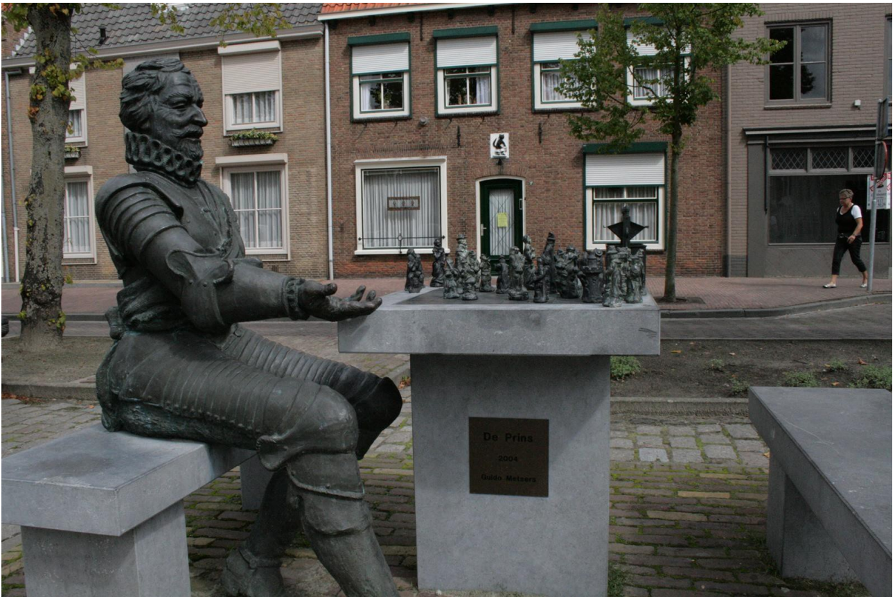
Het beeld van Prins Maurits in IJzendijke