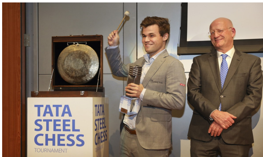
Magnus Carlsen met de overwinningsbokaal