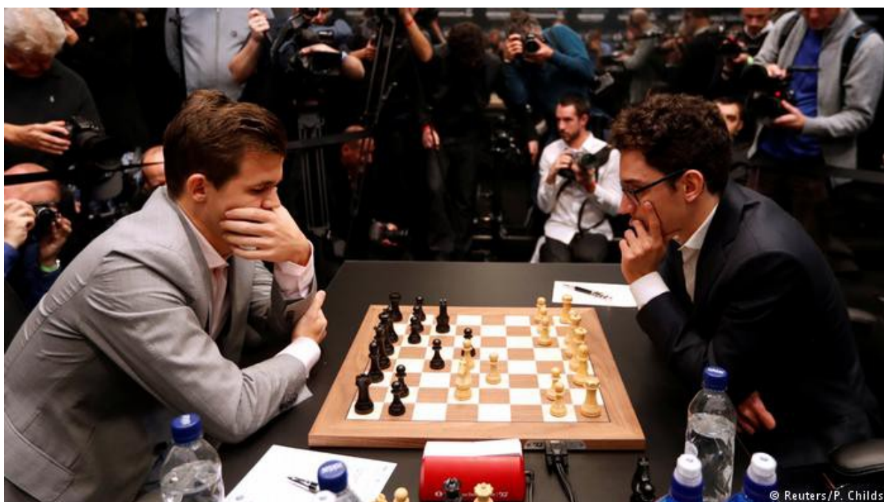
Magnus Carlsen en Fabiano Caruana in actie

De 12 partijen in de WK-tweekamp zitten erop en dat zou normaal een mooi moment zijn om wat partijfragmenten te laten zien waar hetzij Carlsen, hetzij Caruana de winst in een partij had gepakt of de beslissende fout had gemaakt. Maar die partijfragmenten zijn er niet. Twaalf keer remise: ongekend in een WK-match. En al kan van de meeste partijen zeker niet gezegd worden dat het saaie partijen waren, is het helaas geen goede reclame voor de schaaksport. Wie op het scorebord van een WK-match louter en alleen ½-½ ziet staan denkt niet: “Goh, wat een spannende en enerverende sport. Laat ik dat ook eens gaan doen!” Komende woensdag wordt het wel gegarandeerd vuurwerk, als de WK wordt beslist met rapid- of zelfs snelschaakpartijen. Laten we hopen dat dat dan voor positieve reclame voor het schaakspel zorgt.