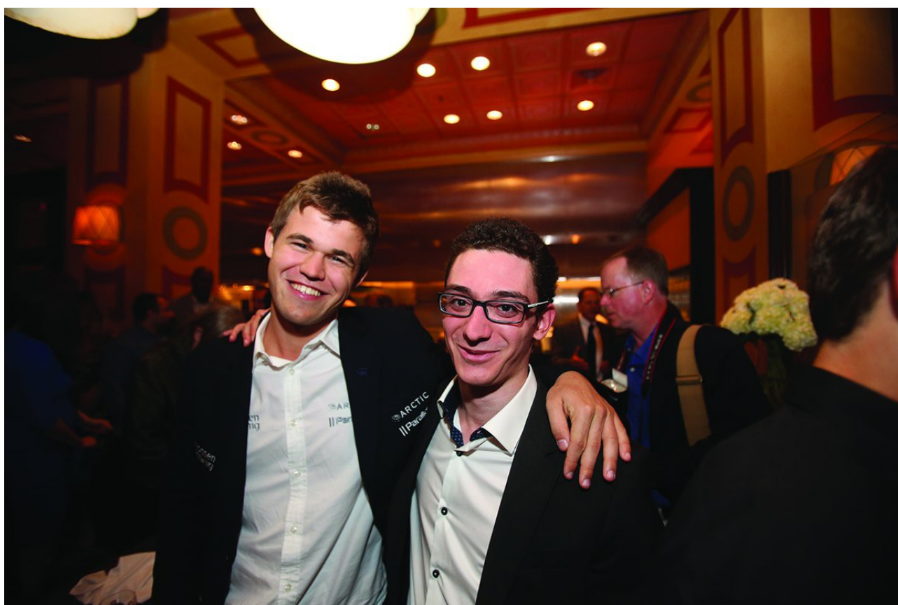
Van een vijandige sfeer is tussen Carlsen en Caruna zeker geen sprake!

Hopelijk kent de WK-match nog een spetterende finale, Want dat mag dan onderhand wel eens na al die remises. U kunt het meevolgen op www.chess24.com of www.schaaksite.nl .