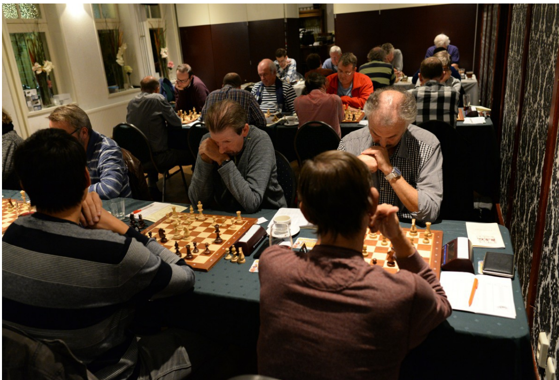
De deelnemers aan het DKR in actie

Gerard Snoeijts had een vrije ronde opgenomen.