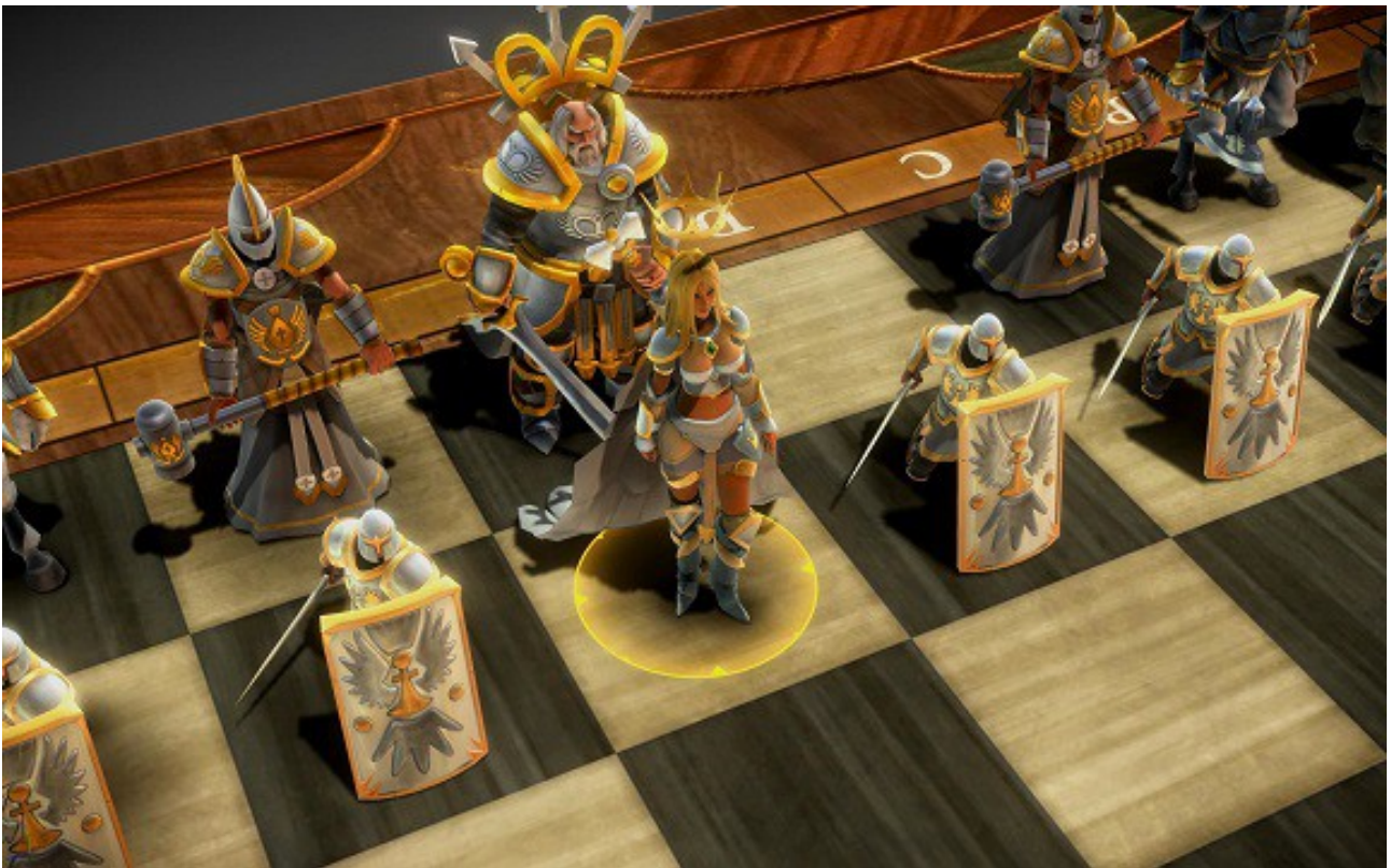
De stukken staan klaar voor de strijd

Op het eind van een lang schaakseizoen treedt bij sommige schakers, zeker als het ook nog eens mooi weer is, een zekere mate van “schaakmoehed” op. Even weinig zin meer om te schaken, liever thuisblijven dan op de clubavond te komen en als er dan toch geschaakt wordt maar gauw remise aanbieden en weer naar huis gaan. Bij Eeuwig Schaak is daar nog weinig van te merken. Ook in mei werd de clubavond nog bijzonder goed bezocht en werd er nog volop strijd geleverd op het bord.