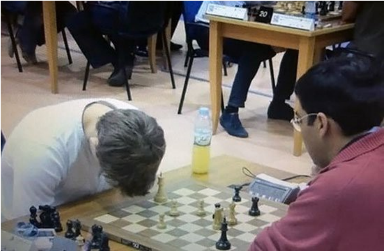
Carlsen beseft dat hij een stuk verliest en zakt zowat door de grond

dat heeft ook zo zijn charme. De blunder van Carlsen verhinderde overigens niet dat hij in 2014 wereldkampioen rapidschaak werd. Hij herhaalde dit in 2015. In 2016 ging de Oekraïner Vassili Ivantsjoek er met de titel vandoor en vorig jaar won Viswanathan Anand. En als zelfs de wereldkampioen rapidschaak een stuk weggeeft... nou ja, dan hoeven wij ons niet te schamen als wij dat ook af en toe doen!