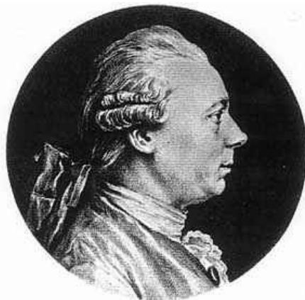
François-André Danican Philidor