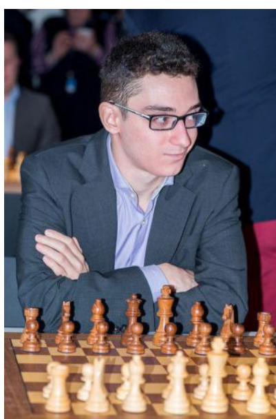
Fabiano Caruana

39. Th1xh6+! Aronian gaf onmiddellijk op. Na 39..., Kxh6 40. Pg4+, Kh7 41. Dxc5 wint wit simpel.