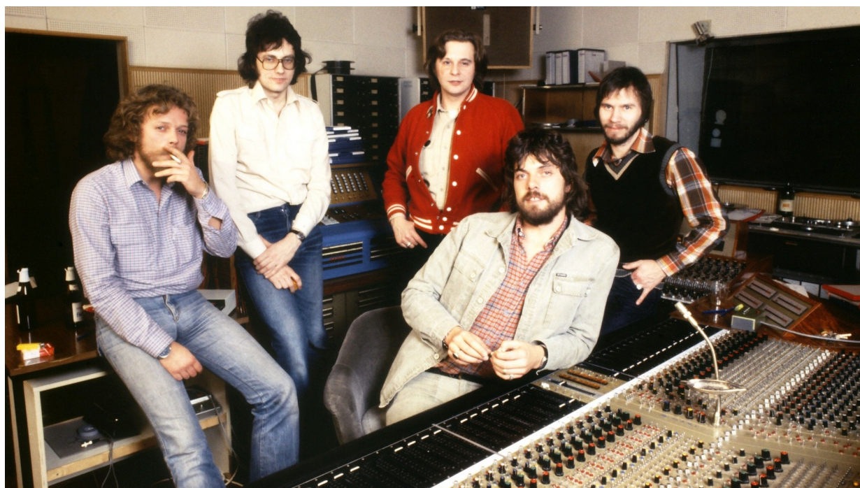
The Alan Parsons Project

Een bekende stelling uit de Siciliaanse opening (klassieke variant), die vele schakers al eens op hun bord gekregen hebben. Op het album “The Sicilian Defence” heeft The Alan Parsons Project over elke aparte zet in deze opening één nummer gemaakt. Een ode aan het schaak- spel en als dat gemaakt is door The Alan Parson's Project, bekend van onder meer het num- mer “Old and wise”, moet dat wel mooi zijn. Helaas valt over dat laatste wel een kanteke- ning te maken.