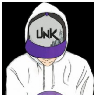
Unk buigt het hoofd