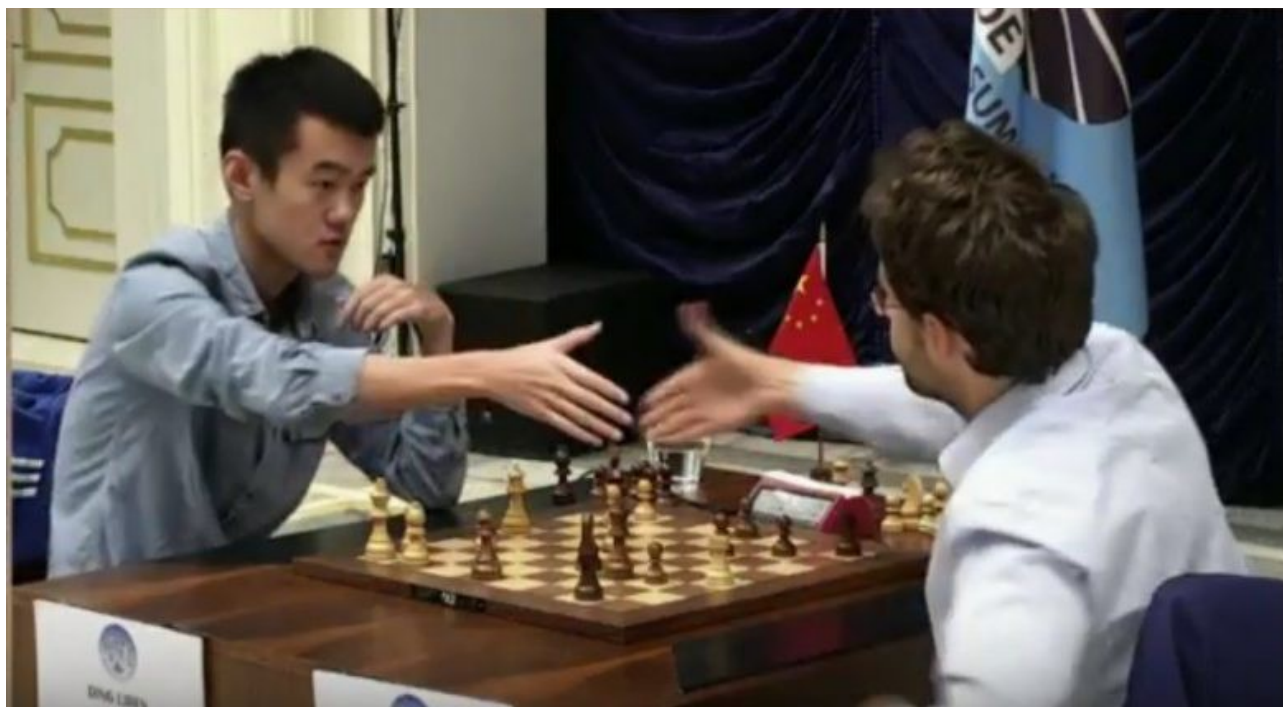
Liren Ding (links) geeft zich gewonnen; Levon Aronian (rechts) is eindwinnaar

Aronian (met wit) speelde hier 30.Tf1-h1 en de zwarte dame sneuvelt. Want op bijvoorbeeld 30...De2 volgt 31.Th6 mat. Ook in de 2e rapidpartij was Aronian Ding de baas en pakte daarmee de World Cup.