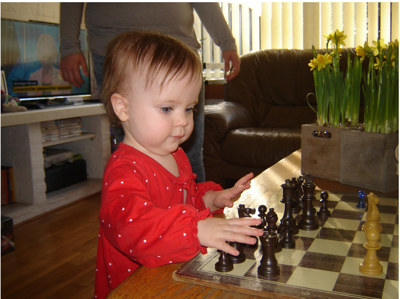
De nieuwe schaakwereldkampioen in actie?

Het zou mooi zijn als Kasparov zijn oude niveau weer hervindt en in het strijdperk treedt met Magnus Carlsen. Wie weet woont de opvolger van wereldkampioenen als Kasparov en Carlsen wel in de buurt van Rucphen. En denkt die toekomstige opvolger nu op dit moment: "Kom, laat ik bij Eeuwig Schaak ook eens een potje gaan schaken."