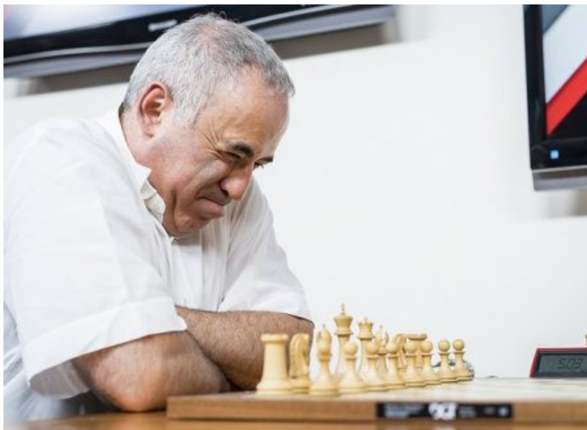
Kasparov in actie in St. Louis

Het nieuws bij Eeuwig Schaak is dat er weer geschaakt wordt. De senioren beginnen op donderdag 24 augustus met een open avond. De jeugd begint op dinsdagmiddag 5 september met een open avond. De senioren spelen van 20.00 uur, de jeugd van 15.30 – 17.00 uur, in beide gevallen in 't Trefpunt in Rucphen. In beide gevallen geldt dat al wie geïnteresseerd is geheel vrijblijvend binnen kan lopen om te kijken of, beter nog, een potje mee te schaken. De internationale schaakwereld zal daar niet wakker van liggen. Daar is ander groot nieuws te melden. Garri Kasparov, de grote kampioen van de jaren '80 en '90 van de vorige eeuw, is terug in de schaakarena! Hij deed mee in het Amerikaanse Saint Louis, waar een rapid- en blitztoernooi werd gehouden.