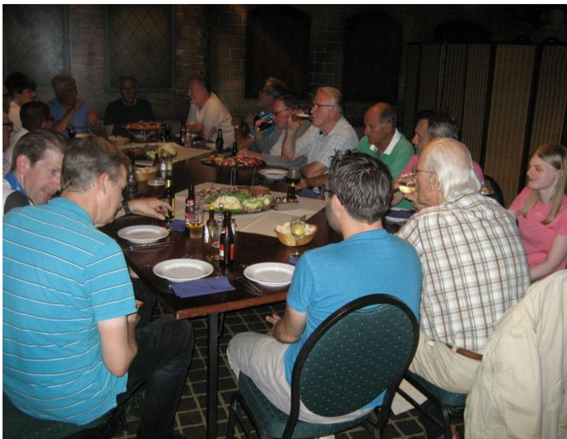
Gezelligheid troef tijdens de feestavond

De feestelijke avond werd zoals elk jaar afgesloten met een diner in 't Trefpunt in Rucphen en zoals elk jaar was er ook nu weer een speciale gast. Dit keer was dat de Amerikaanse president Donald Trump (vergezeld van zijn dochter Ivanka), die vertelde dat hij eigenlijk voorzitter wilde worden van Eeuwig Schaak en daarom alles in het werk heeft gesteld om niet als president verkozen te worden, maar dat dat jammerlijk is mislukt.