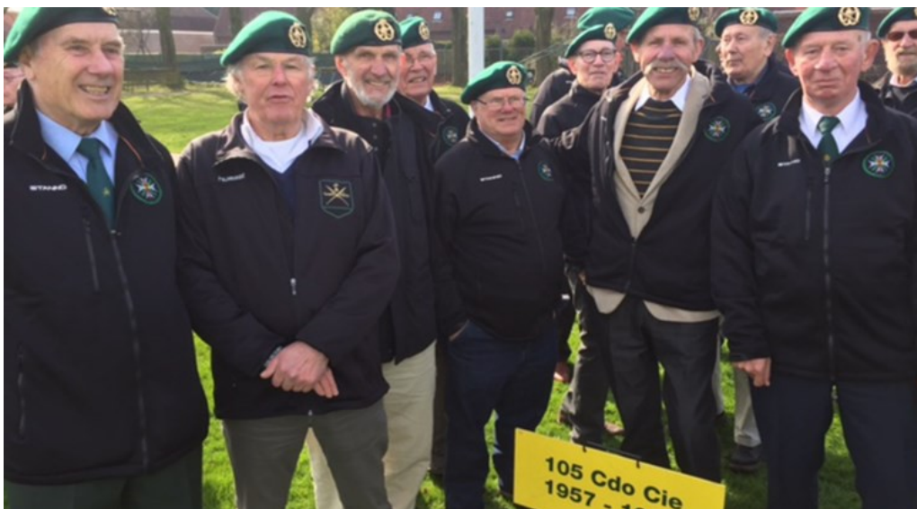
Enkele van de commando's die waakten over Roosendaal tijdens het Tweetallentoernooi