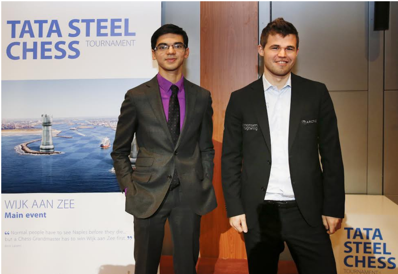
Anish Giri en Magnus Carlsen

Carlsen (met wit) speelde 56.Lf7+ en won een toren, maar er had meer in gezeten: 56.Tc7-c8+,Kg8-g7 57.Tf5-f7+,Kg7-h6 58.Tc8-h8 en mat. Giri had het mat in 3 kunnen voorkomen met 56...,Te8, maar dan is de partij natuurlijk net zo goed over. Zo blijkt: ook Magnus Carlsen is maar een mens. Giri reageerde achteraf: "This must be the most embarrassing moment of his chess career. I feel really bad for him." Wat is schaken toch een unieke sport. Iemand ontsnapt aan verlies tegen de wereldkampioen en vind dat vervolgens rot voor die wereld-kampioen. En dit was echt geen sarcasme: hij meende het echt!