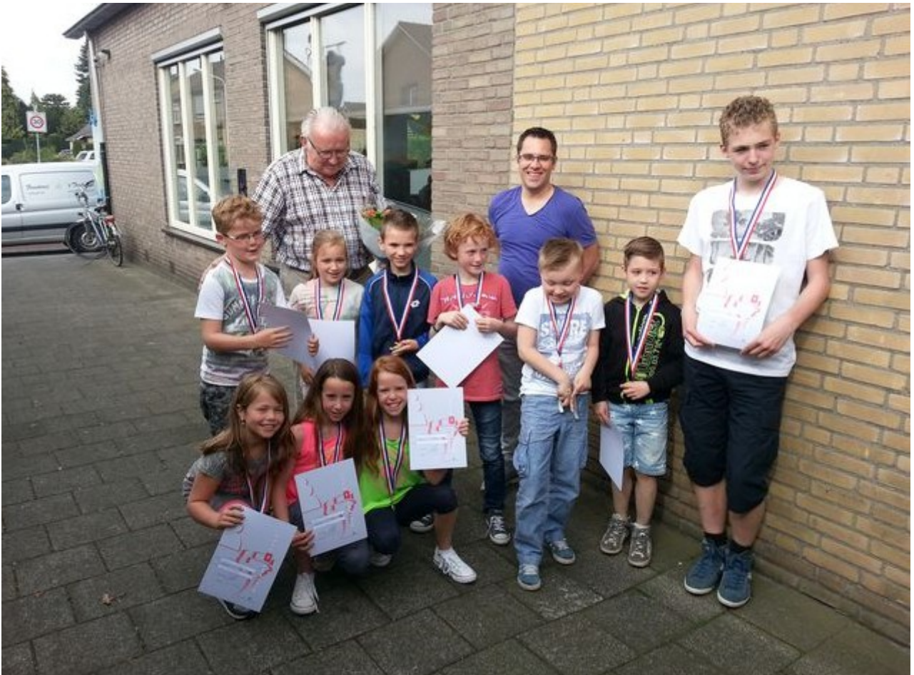
De jeugdafdeling van Eeuwig Schaak van dit seizoen