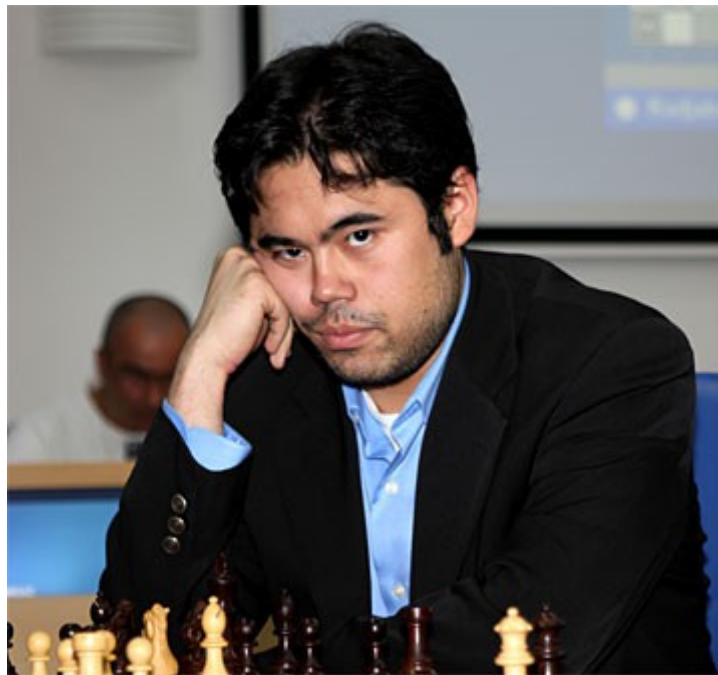
Hikaru Nakamura was (wederom) niet blij...

Nakamura staat er hier niet goed voor. Maar met bijvoorbeeld Te2 kan hij nog proberen de e-pion tegen te houden en stelling remise te keepen. Maar tot ieders ontsteltenis raakte Nakamura de koning aan, liet hem snel weer los en wou toen alsnog met de toren zetten. Daar nam Aronian uiteraard geen genoegen mee. De scheidsrechter werd erbij gehaald (jawel, ook schaken kent scheidsrechters), Nakamura werd gedwongen met de koning te zetten en na 74...,Kf8 75.Kf6,Ta6+ (gedwongen, anders volgt mat) 77.Td7-d6 stond Nakamura er nog een stuk beroerder voor en kon hij snel opgeven. Een mooi videofragment van dit incident is te zien op http://www.schakers.info/?p=11536 .