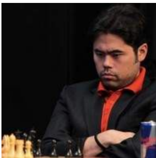
Hikaru Nakamura heeft er de pee in...