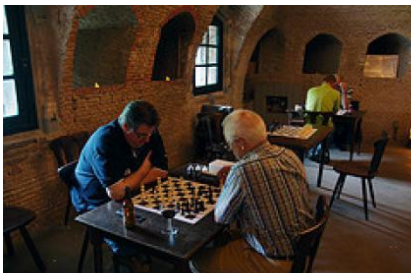
Binnenin Fort Sabina