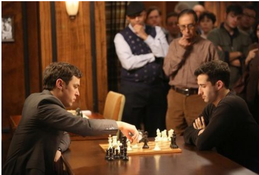
Scène uit “Bones”

Mat zetten met 2 lopers kan ook nog lastig zijn, maar wie dat enigszins oefent lukt dat wel. Je hoeft daarvoor geen supergrootmeester te zijn of exclusief les te hebben gehad van Kasparov, zoals in een onlangs uitgezonden aflevering van de serie “Bones” werd beweerd. Het is altijd aardig dat de schaaksport aandacht krijgt in series op televisie, maar met name in Amerikaanse series wordt er nogal wat onzin beweerd over het schaken. En worden schakers steevast neergezet als extreem intelligente, maar ook extreem arrogante en sociaal zwak begaafde mensen. Volslagen onzin, uiteraard. Om te schaken hoef je echt niet extreem intelligent te zijn, arrogant zijn leden van schaakverenigingen zelden en ze zijn echt niet allemaal sociaal zwak begaafd. Schakers zijn, hoe verrassend het mag klinken, over het algemeen gewoon doorsnee mensen, net als mensen die niet schaken. En je hebt ze, net als niet-schakers, in allerlei soorten en maten.