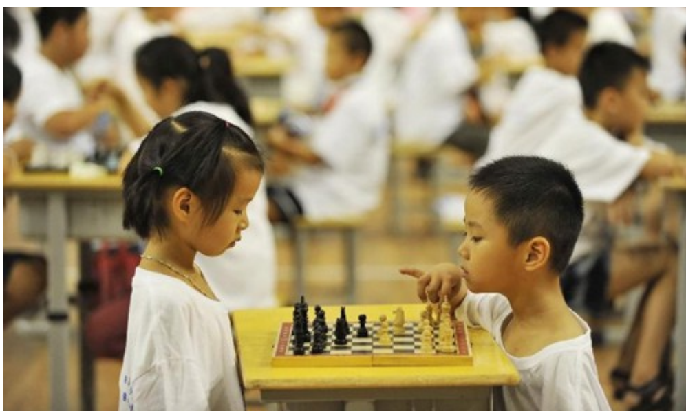
En ook in China geldt: jong geleerd is oud gedaan!

En dan te bedenken dat naast Ding Liren, Hou Yifan en Wei Yi nog een hele horde Chinezen klaar staat om de schaakwereldtop te bestormen. Zo won Yu Yangyi onlangs in één toernooi van zowel Vladimir Kramnik als Anish Giri. Het moge duidelijk zijn: de Chinezen komen eraan!