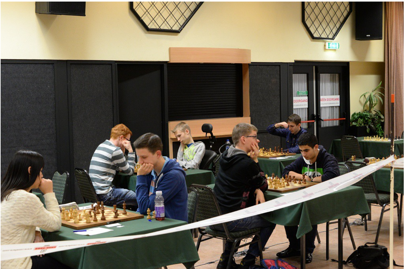
Schaaktalenten in actie op het Brabants jeugdschaakkampioenschap