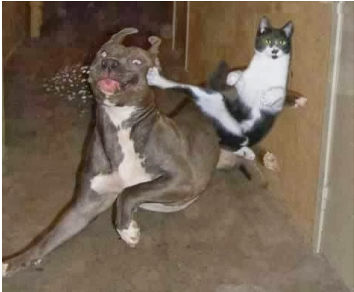
Al blijft het wel oppassen voor Karate-Kat...

teen maar een vol stuk weg en gaf meteen op, maar ook met elke willekeurige andere zet was het snel uitgeweest voor hem. Een kat in het nauw maakt rare sprongen, maar springt ook wel eens de verkeerde kant op.