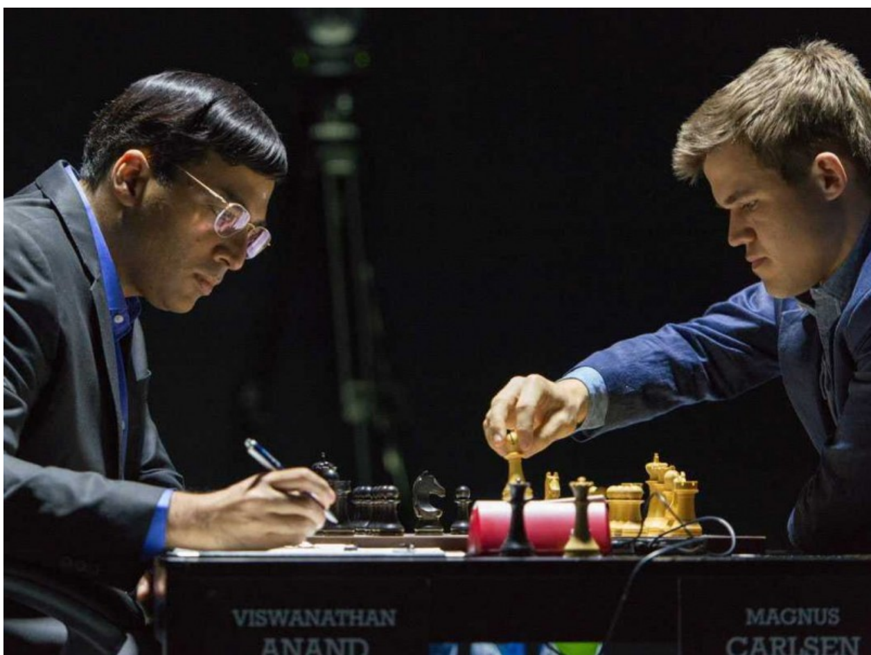
De twee matadoren in actie