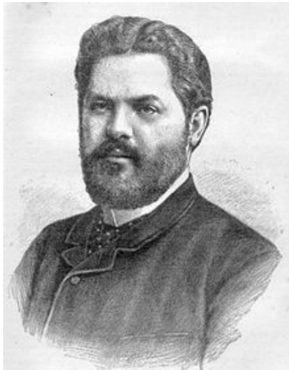
Semion Alapin (1856-1923), naar wie de Alapin-variant is vernoemd