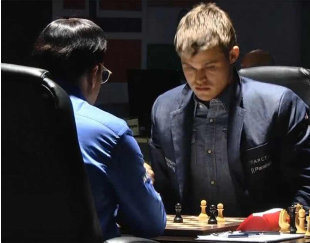
Carlsen kijkt vol verbazing naar Anands laatste zet