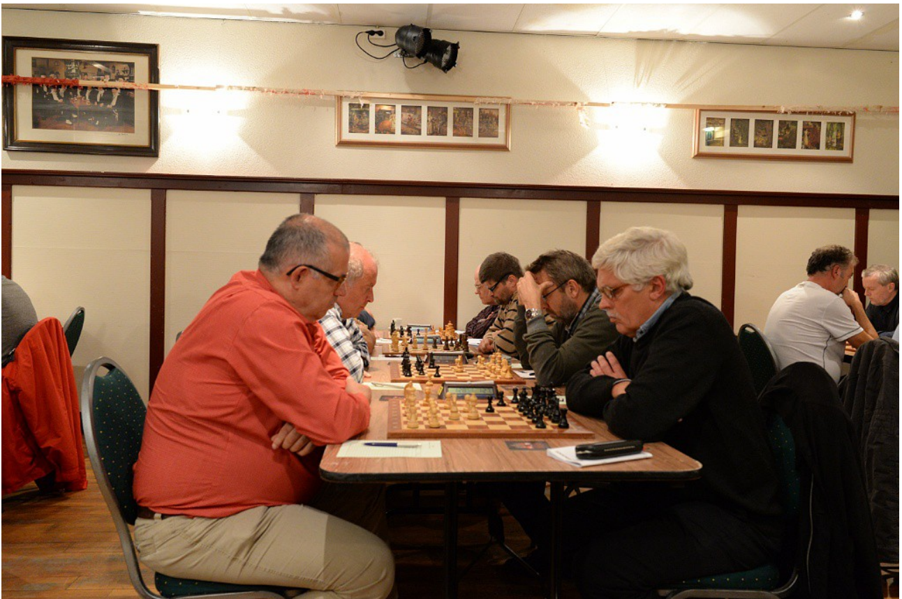
De teams van RSG (links) en Eeuwig Schaak (rechts) in actie