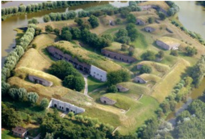
Luchtfoto van Fort Sabina

Fort Sabina is een in 1809 door de Fransen aangelegd verdedigingswerk in de buurt van Willemstad. Nederland was destijds bezet door de Franse troepen van Napoleon en was een verdediging tegen invallende Engelse troepen. Op 19 oktober a.s wordt in Fort Sabina een schaaktoernooi georganiseerd door de Hoevense schaakvereniging De Schaakhoeve. Meer informatie over dit toernooi op deze bijzondere lokatie vindt u op www.schaakhoeve.nl .