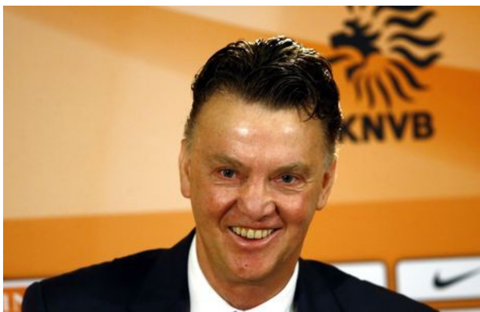
Louis van Gaal ziet het helemaal zitten

Deze rubriek houdt er nu even een tijdje mee op, net als Eeuwig Schaak. Op 28 augustus beginnen de senioren aan het nieuwe seizoen, de jeugd begint op 2 september. Tot die tijd houden de schakers zich even met andere dingen bezig. Bijvoorbeeld met het WK voetbal, dat op 12 juni begint. Louis van Gaal is persoonlijk langsgekomen op de feestavond van Eeuwig Schaak om zijn (door Eeuwig Schaak geïnspireerde) tactiek tegen Spanje toe te lichten. We mogen uiteraard niet verklappen wat die tactiek is, maar die eerste 3 punten zijn voor Nederland gegarandeerd binnen!