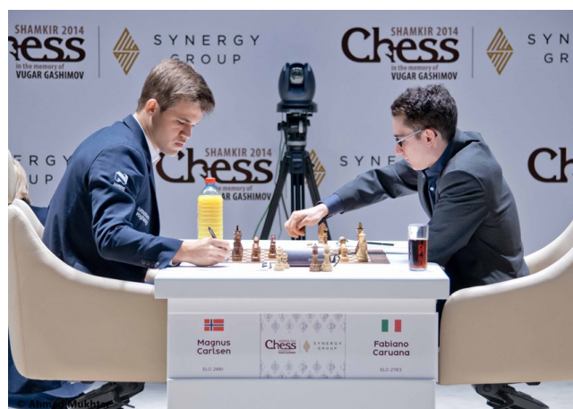
Magnus Carlsen en Fabiano Caruano

25.Pd5xc7!! Op 25...,Kxc7 volgt 26.e6+ en wit wint de pion terug met straal gewonnen stelling. Carlsen speelde 25...,Te8-d8 en de verloren pion nekte hem op het eind. Als zelfs Carlsen soms iets over het hoofd, ach... dan hoeven wij ons niet te schamen!