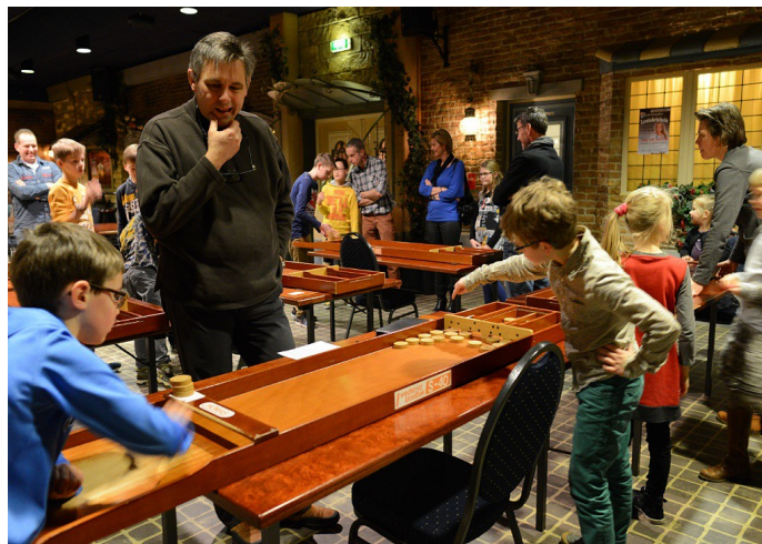
Veel enthousiasme bij het sjoelen

Voor de jeugd en hun ouders, broertjes en zussen werd op zondag 9 februari een gezellige middag georganiseerd met sjoelen en spelletjes die veel of weinig met het schaakspel te maken hadden. De ouders kregen vooraf een korte uitleg over de regels van het schaakspel en ontdekten dat ze al snel ook een partijtje konden spelen. De ouders en andere familieleden konden zo kennismaken met de club, maar het belangrijkste was dat iedereen gewoon een leuke middag had.