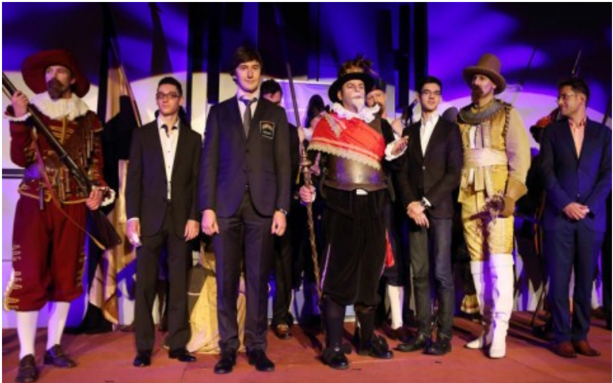
Eén ronde van het toernooi werd gespeeld in het Amsterdamse Rijksmuseum