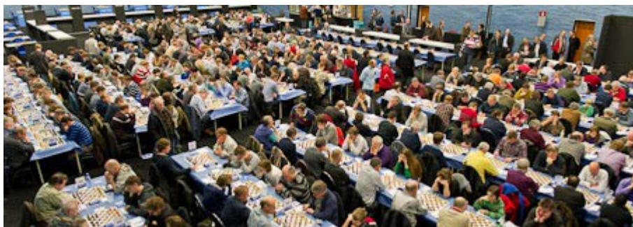
Impressie van het Tata Steel Chess toernooi.