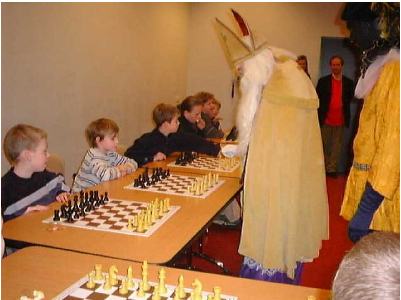
Sinterklaas geeft simultaan in het Limburgse Voerendaal

Op donderdagavond 5 december gaat de clubavond van Eeuwig Schaak gewoon door. Er wordt dan geen competitie gespeeld, omdat te verwachten valt dat een aantal leden toch liever thuis Sinterklaas zal vieren. Daarmee ligt de interne competitie overigens wel wat weken stil. Op de clubavond van 28 november was er geen interne competitie ingepland, 5 december is het Sinterklaas en de week erop, op 12 december, speelt het viertal van de Avondcompetitie tegen Schaakhoeve. Die wedstrijd is een week vervroegd in verband met het jaarlijks Kersttoernooi in Hoeven op 19 december. Of op 5 december weer giftige pionnen worden weggegeven of onvrijwillig echte kado's op het bord worden weggegeven zullen we nog wel zien. Kado's van schakers wantrouwen geldt alleen voor hetgeen op het bord gebeurt; als een schaker een drankje aanbiedt is heel normaal en is er geen enkele reden dat te wantrouwen. Er zijn al vele jaren geen schakers overleden door gif in hun drank en dat zal bij Eeuwig Schaak ook zeker nooit gebeuren!