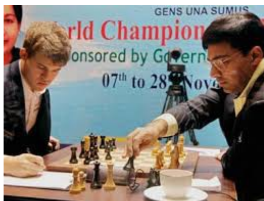
Carlsen en Anand in actie

Magnus Carlsen is hier met zwart aan zet. In een pionneneindspel gaat het er niet om wie de meeste pionnen heeft, maar wie het eerst een pion aan de overkant krijgt. Carlsen beseft dat maar al te goed en offert zijn h-pion op om zijn f-pion de vrije doorgang te geven: 60...h4-h3 61.g2xh3,Tg3-g6 62.c3-c4,f4-f3 63.Ta4-a3+,Ke3-e2 64.b2-b4,f3-f2 65.Ta3-a2+,Ke2-f3 66.Ta2-a3+,Kf3-f4 67.Ta3-a8,Tg6-g1 en wit gaf op. Anand kan de promotie van de f-pion niet meer voorkomen, tenzij hij er zijn toren voor geeft.