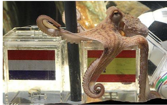
Paul de Octopus