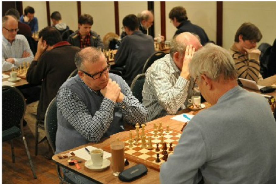
Impressie van het Districtskampioenschap van vorig seizoen