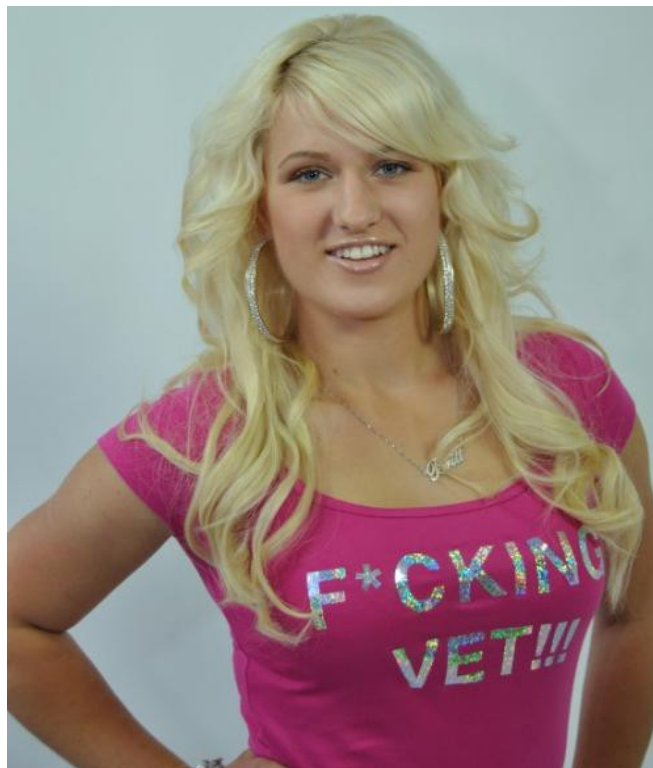
Zelfs zij kan leren schaken!

Over schaken en schakers bestaan veel misverstanden. “Schaken is heel moeilijk en om te leren schaken moet je superintelligent zijn.” Niets is minder waar. De regels van het schaakspel zijn heel makkelijk en voor iedereen te leren. Leden van een schaakclub zijn hele normale mensen uit alle lagen van de bevolking. Goed schaken is moeilijk en om grootmeester te worden moet je heel wat extra weten en bovenmatig intelligent zijn. Dat is wel waar. Maar het is hetzelfde als met voetbal: tegen een bal trappen kan iedereen, maar voetballen zoals Lionel Messi is bijzonder moeilijk. Maar net zoals Lionel Messi niet bij RSV voetbalt (hoewel, de transferperiode is nog niet voorbij, we blijven hopen...), spelen er geen grootmeesters bij een club als Eeuwig Schaak. Iedereen die tot 10 kan tellen kan een aardig potje leren schaken.