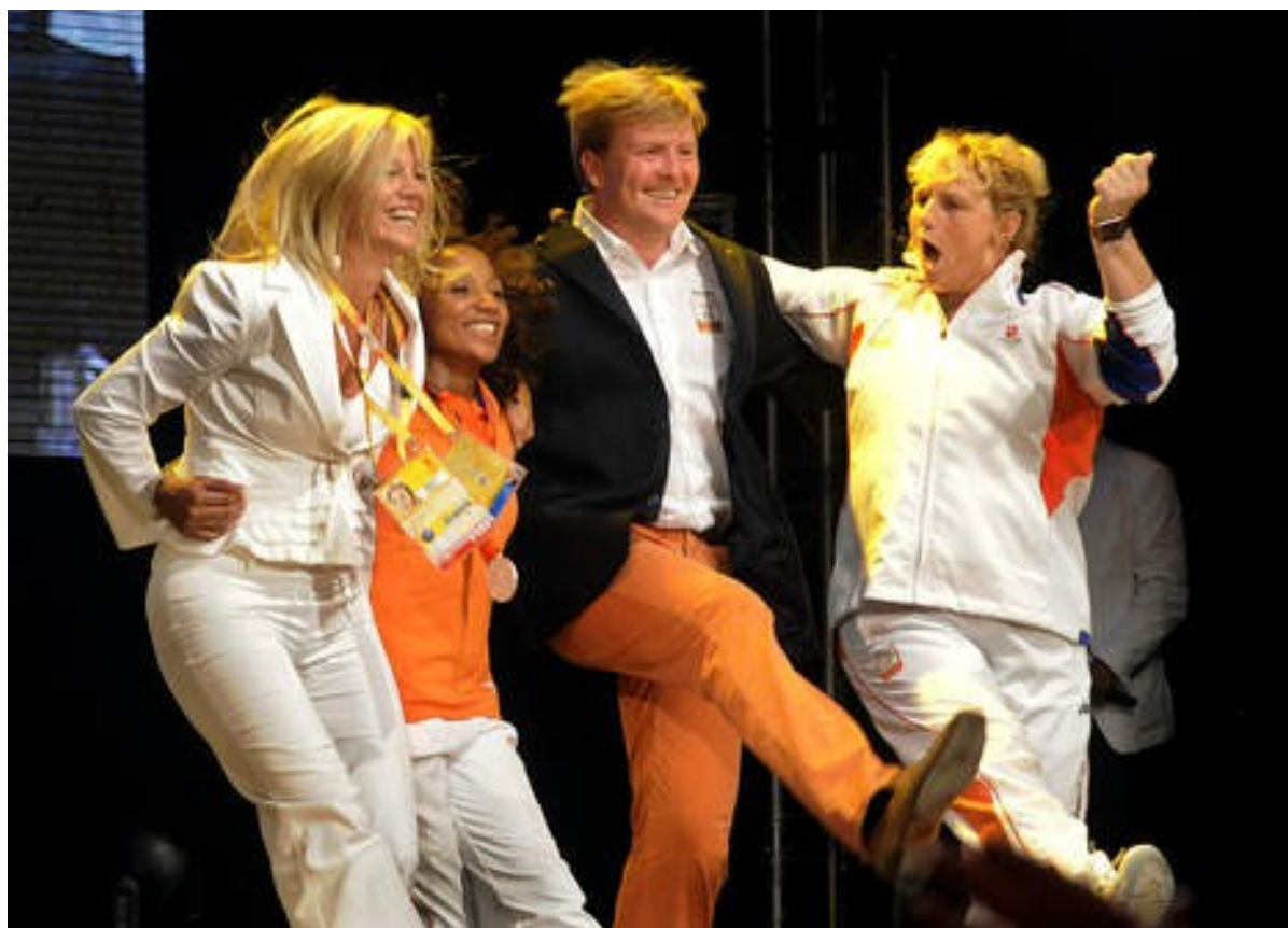
Willem-Alexander na het winnen van een schaakpartij

Voor wie intussen nog niet genoeg heeft van “de W van Willem” (en ook voor wie daar intussen wel de buik van vol hebben) is er een leuke schaakpuzzel te vinden op internet op http://schoolschaaksite.nl/page.php?al=schaakpuzzel-voor-onze-koning . Voor wie dit adres te lang is om te onthouden: ga naar http://schoolschaaksite.nl , scroll wat naar onder en klik op “Schaakpuzzel voor onze Koning”. Een leuke manier om de meivakantie mee door te komen!