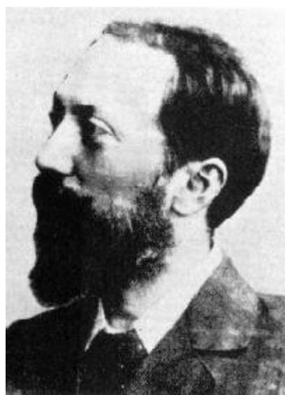
Curt von Bardeleben

Het vervolg van de partij, zoals witspeler Steinitz die voorzien had en zwartspeler Von Bardeleben ook wel zag aankomen, was als volgt: 25....,Kh8-g8 26.Th7-g7+,Kg8-h8 27.Dg4-h4,Kh8xg7 28.Dh4-h7+,Kg7-f8 29.Dh7-h8+,Kf8-e7 30.Dh8-g7+,Ke7-e8 31.Dg7-g8+,Ke8-e7 32.Dg8-f7+,Ke7-d8 33.Df7-f8+,Dd7-e8 34.Pg5-f7+,Kd8-d7 35.Df8-d6 mat. Deze prachtige combinatie is nooit op het bord verschenen, maar Von Bardeleben gaf ook niet op. Hij liep gewoon weg, waarna Steinitz 50 minuten moest wachten tot Von Bardelebens tijd verstreken was en hij de winst kon opeisen. Dit gedrag van Von Bardeleben schokte de schaakwereld en heeft hem levenslang het imago van slecht verliezer opgeleverd. De roman The Luzhin Defense van Vladimir Nabokov, die in 2000 verfilmd werd, is gebaseerd op het leven van Curt von Bardeleben, die in 1924 tragisch aan zijn eind kwam door uit het raam van een hotel te springen.