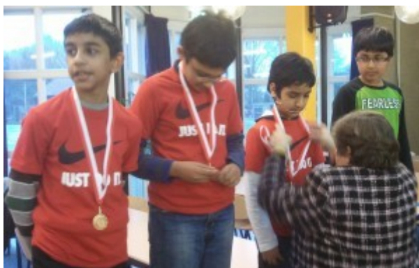
Het team van de Internationale School Eindhoven