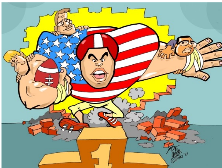
2011: kleine Nakamura is groot geworden...