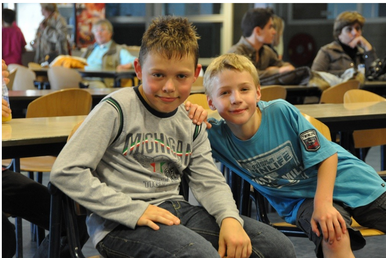
De schaakjeugd van Eeuwig Schaak is van niemand bang!

Afgelopen zondag vonden de districtskampioenschappen voor de jeugd plaats in het Jan Tinbergen College in Roosendaal. De jeugd van Eeuwig Schaak was daar zeer succesvol. Hierover volgende week meer!