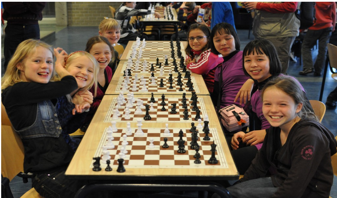
En schaken is dus niet alleen voor jongens!