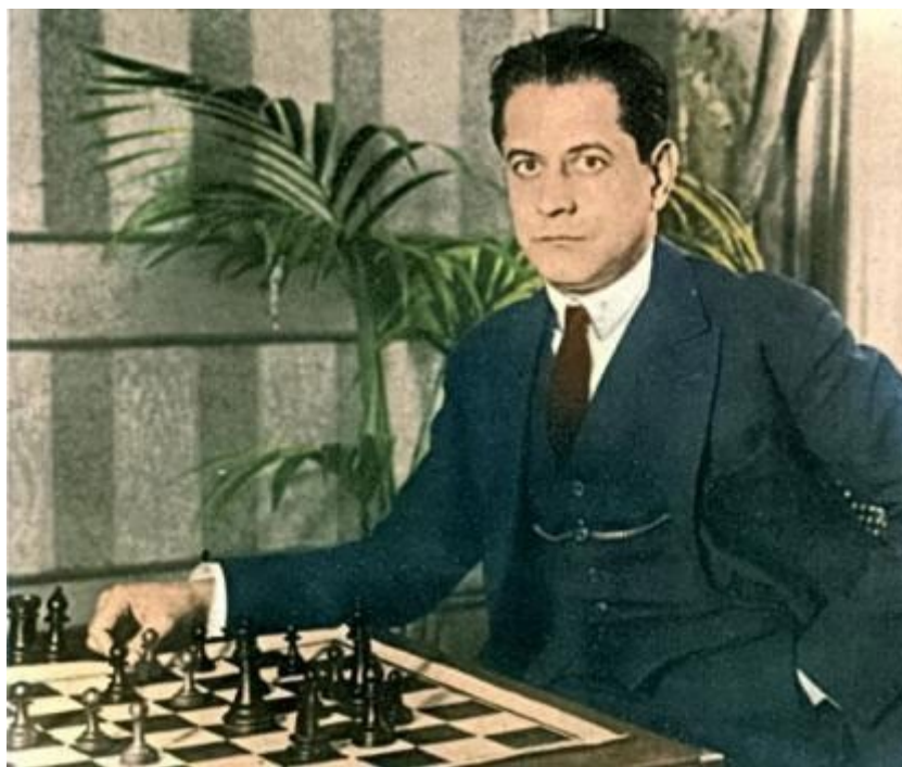
José Raúl Capablanca

José Raúl Capablanca (1888-1942) wordt nog altijd door veel schakers beschouwd als de sterkste schaker uit de geschiedenis. Sporters uit verschillende tijden met elkaar vergelijken is altijd lastig, ook in de schaaksport en natuurlijk worden ook andere namen genoemd, met name die van Bobby Fischer en Gary Kasparov. Noem één van de laatste twee namen en je hebt gegarandeerd een discussie, noem de naam van Capablanca en iedereen zwijgt respectvol.