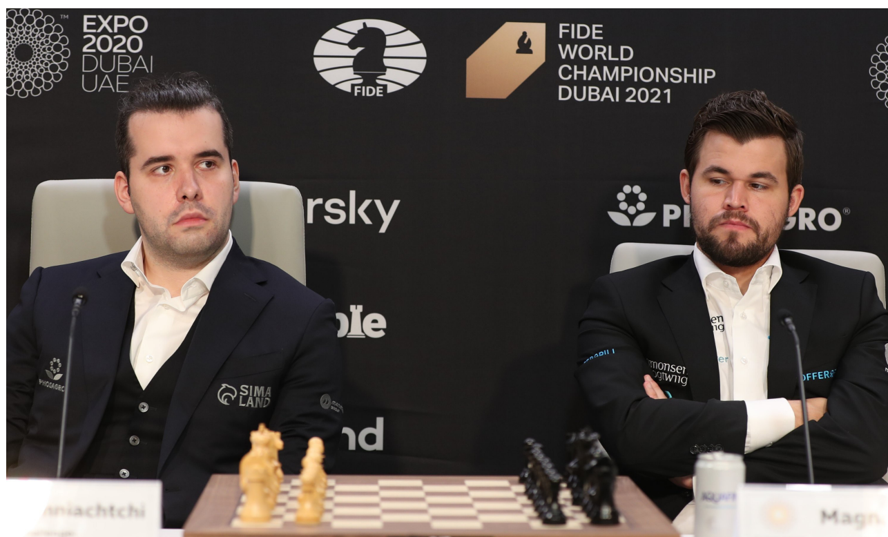
Jan Nepomnjasjtsji en Magnus Carlsen

Maar natuurlijk kijkt heel schaakminnend Nederland en eigenlijk alle schaakliefhebbers in de wereld momenteel naar Dubai. Daar wordt de WK-match tussen Magnus Carlsen en Jan Nepomnjasjtsji gespeeld. De eerste 3 partijen waren juweeltjes. Remises, maar allesbehalve saaie remises. Carlsen is favoriet, maar heeft het in het verleden toch vaak lastig gehad tegen “Nepo”. Alles wijst erop dat dit een prachtige tweekamp gaat worden.