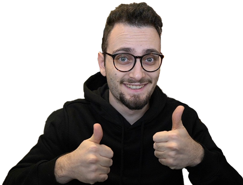
Levy Rozman, alias GothamChess

Een populaire schaak-You-Tuber is GothamChess . Helder, amusant en leerzaam voor alle schaakliefhebbers, wel in het Engels, maar dat zal voor de meesten geen probleem zijn. De echte naam van deze You-Tuber is Levy Rozman , een schaakmeester uit New York.