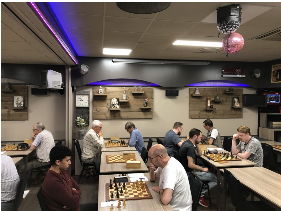
Beeld van de Schaak-Off in Roosendaal

Er zijn momenteel zeer veel huisschakers actief op internet. Schaken is momenteel “booming”, met name onder jongeren. Als die straks naar de schaakclubs komen, kunnen de huidige clubspelers hun borst nog nat maken. Maar die zullen ze niettemin graag zien komen, want nieuw bloed is altijd welkom! Ook bij Eeuwig Schaak overigens.