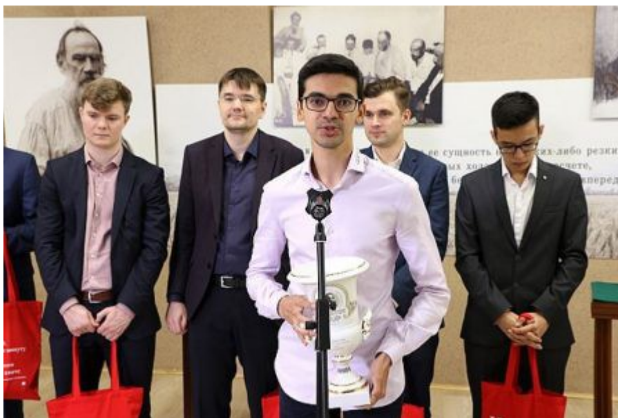
Anish Giri tijdens de slotceremonie van de Tolstoj Cup

Anish speelde met wit 42.Tf8-g8+!,Kg7-f6 (42...,Kxg8 43.e7-e8D+). Als Anish zijn pion tot dame laat promoveren slaat zwart de witte dame, maar Anish doet het anders: 43.e7-e8P+! Heel elegant. Zwart gaf meteen op.