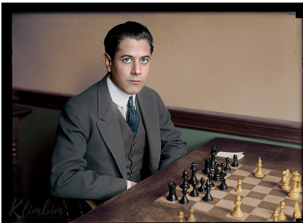
José Raúl Capablanca

Dit jaar is het 100 jaar geleden dat de Cubaan José Raúl Capablanca wereldkampioen werd. In discussies wie nu eigenlijk de beste schaker ooit was, komt de naam van Capablanca steevast bovendrijven. Samen met die van onder meer Bobby Fischer, Gari Kasparov en Magnus Carlsen. De discussie over de beste schaker ooit is eigenlijk een onmogelijke discussie, want hoe vergelijk je schakers uit verschillende periodes die niet of amper tegen elkaar gespeeld hebben? En de schakers van tegenwoordig hebben de beschikking over geavanceerde computers en databases, terwijl een speler als Capablanca het 100 jaar geleden met aanzienlijk minder informatie moest stellen. Capablanca was een uiterst geraffineerde speler, die bijzonder goed was in het eindspel en kleine voordeeltjes maximaal uit kon melken. Wat dat betreft had hij veel gemeen met de huidige wereldkampioen Magnus Carlsen.