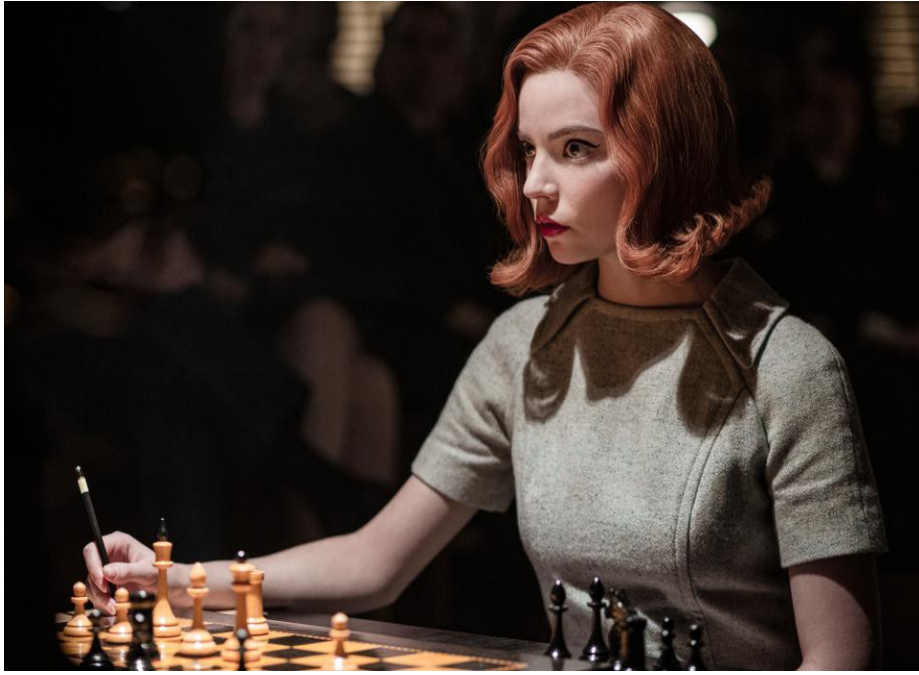
Anya Taylor-Joy als Beth Harmon