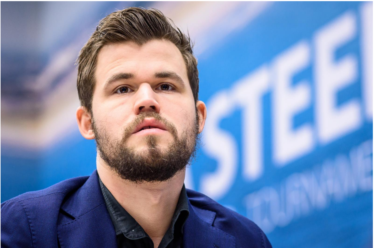
Magnus Carlsen